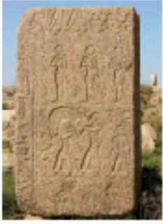
Fig. 2 شكل ٢

بوباتيس: هو الاسم الذي اطلقت اليونان على المدينة المصرية (بر باستيت) والذي يعني بيت الالهة باستيت. خرابتها تعرف اليوم بتل بسطة وتقع على حدود مدينة الرقازيق الجديدة. زار المؤرخ اليوناني الشهير (هيرودوتس) المكان سنة ٤٢٥ ق.م، تقريبا وترك وصفا حيا للمدينة ومعبدها. بدأت الابحاث العلمية هنا منذ اواخر القرن التاسع عشر، مؤخرا تم العثور على تمثال ضخم لملكة من عصر الرعامسة (شكل ١).