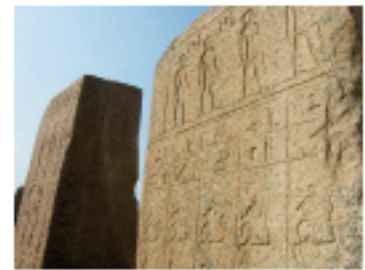
Fig. 5 شكل ٥

Modern visitors still can see hundreds of blocks of pink granite decorated with numerous figures of courtiers and priests partaking in the ceremonies (Figs. 2, 5). Other temple remains include fragments of columns, Hathor head capitals (Fig. 4), and statues. They belong to different construction phases of the temple dating to the reigns of Osorkon I and II, and Nectanebo II. The most ancient remains, however, belong to the so-called ka -temple of the spirit ( ka ) of king Pepi I.