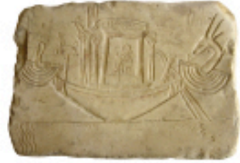
Fig. 3 شكل ٣

In antiquity Bubastis was famous for the annual celebrations of the feline goddess Bastet (Fig. 6), during which boat processions took place accompanied by music, dance and the consumption of wine and beer (Fig. 3). Egyptological interest focusses on another festival: the royal jubilee or heb-sed of pharaoh Osorkon II (ca. 857-825 B.C.), which is depicted on the temple walls. This festival took place in the 30th regnal year of an Egyptian king.