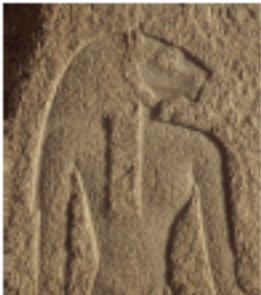
Fig. 6 شكل ٦

لا يزال بإمكان زوار المكان مشاهدة المئات من احجار الجرانيت الوردي المزينة باعداد هائلة من صور حاشية الملك والكهنة خلال اقامة الاحتفالات (شكل ٣,٥). بقايا اخرى من المعبد تمثل اجزاء اعمدة وتيجان على شكل الالهة حتحور (شكل ٤) وتمثيل جميعها تؤرخ لفترات مختلفة عن فترة بناء المعبد الذي يرجع ل(اوسوركون) الاول والثاني و(نكتانيبو) الثاني، غير ان اقدم البقايا الاثرية تعود الى ما يدعى معبد (كا) الذي يرجع للملك (بيبي) الاول.