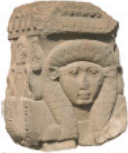
Fig. 4 شكل ٤

كانت بوباتيس القديمة مشهورة باحتفالاتها السنوية التي تمجد الالهة القطية باستيت (شكل ٦) والتي كان خلالها يتم تسيير المواكب الاحتفالية مصحوبة بالموسيقى والرقص وشرب البيرة والخبز (شكل ٣). اليوم يركز علماء الآثار اهتمامهم على احتفال آخر الا وهو اليوبيل الذهبي او (هب-سد) للملك اوسوركون الثاني (٨٥٧-٨٢٥ ق.م) المصور على جدران المعبد. اقيم هذا الاحتفال في العام الـ ٣٠ من حكم ملك مصر.